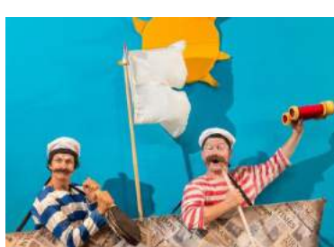
הנה הם שטים באוניה