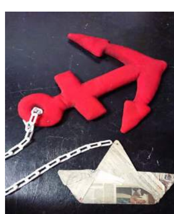
זה עוגן וסירה קטנה