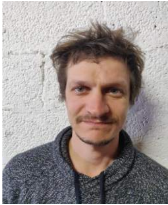
וככה לושה נראה באמת

בהצגה יש שני חברים שמפילים בטעות את השמש לים, מפליגים למסע חיפוש בסירה קטנה, בדרך נאבדים, רבים, כמעט טובעים בים הגדול. ולבסוף, הם מוצאים איש את חברו.