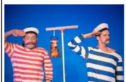
הליצנים מתכוננים לשיט