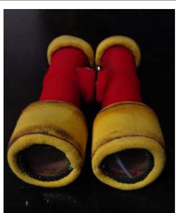
זו המשקפת שלהם