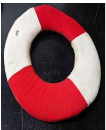
זה גלגל הצלה