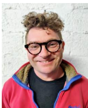
ככה פדיה נראה באמת