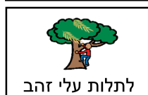
לתלות עלי זהב