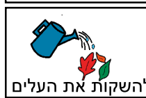
להשקות את העלים