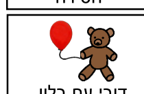
דובי עם בלון